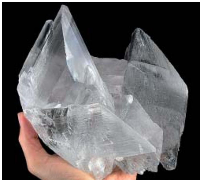
Naicako hainbat kristal.