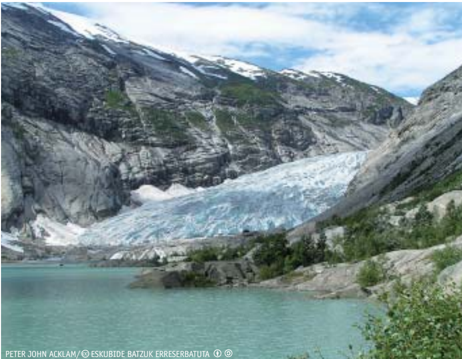
PETER JOHN ACKLAM/© ESKUBIDE BATZUK ERRESERBATUTA ⓘ ⓘ