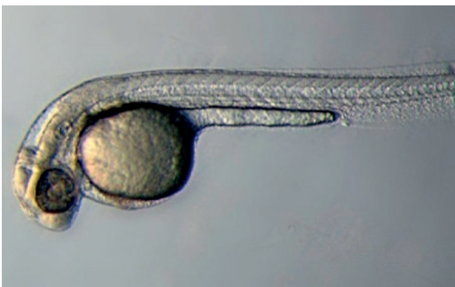
Zebra-arrainaren enbrioiak eredu egokia dira sendagaien eraginak ikertzeko.

Gogorazi dutenez, pertsonetan, kortisol-maila baxua neke kronikoarekin eta beste asaldura batzuekin lotzen da. Horrenbestez, fluoxetina epe luzez eta haurdunek erabiltzeak eragin ditzakeen ondorioak hobeto ikertzeko eskatu dute ikertzaileek. ●