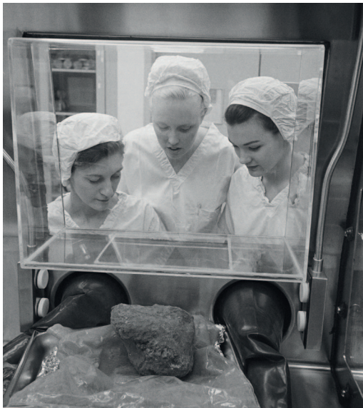
NASAko hiru teknikari 14321 arrokari begira.

Earth and Planetary Science Letters aldizkarian argitaratu dute ikerketa. Haren arabera, aurkikuntza aparta da, Lurrean ez baitaude garai hartako arrokak. Zaharrenak Australian daude eta 4.400 milioi urte dituzte, baina mineral batzuk dira; jatorrizko arrokak deseginda daude.