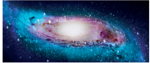
Esne Bidearen bihurtura erakusten duen irudikapena.

Esne Bidearen 3Dko mapa bat eginez, galaxiaren bihurtura zenbatekoa den neurtu dute zientzialari txinatar eta australiar batzuek. Nature Astronomy aldizkarian eman dute horren berri .