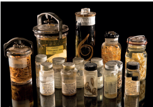
Sminthonian Institutuan gordetako bizkarroi-bildumaren lagin bat.

Edonola ere, galerak ekosistemetan eragin handia izango lukeela adierazi dute. Horrenbestez, klima-aldaketaren ondorioak aztertzean, espezie jakinetan arreta jarri beharrez, ekosistema osoak aintzat hartzea proposatu dute, benetako egoera hobeto aurreikusiko dutelakoan. ●