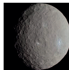
Ceres asteroidea.

aztertzen ari zirela, ikertzaileek absortzioa hauteman zuten materia organiko alifatikoaren zenbait osagai dagoen uhin luzeretan, ikusgai-infragorri espektrometria bidez. Ikertzaileen arabera, gainera, material organiko hori asteroidean bertan sortu zen; izan ere, kanpotik iritsia balitz, beste asteroide horrek Ceresen kontra jotzean sortutako beroak deuseztatu egingo bailitu. Science aldizkarian argitaratu da ikerketa . ●