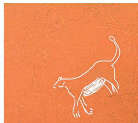
Lehoi baten grabatua azaldu da Armintxe kobazuloan, Kantaurin azaldu den aurrenekoa.