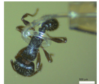
Mikrogarro robotikoa gai da inurri bat hartzeko, minik egin gabe.

185 mikrometroko diametroa arte txikitu daiteke garroak egiten duen azken espiralak. Hain zuzen ere, robotika biguna (sistema biologikoak oinarri hartzen dituena) hain neurri txikira arrakastaz ekartzea izan da ikerketaren ekarpen nagusia. Orain arte, zentrimetroaren eskalan bakarrik lortu zen sistemak kiribil bat baino gehiago osatzea.