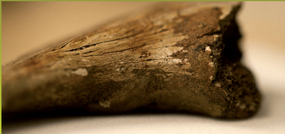
Teropodo baten hatzaparra. Fosil honetan aurkitu dituzte globulu gorrien itxurako egiturak.

Globulu gorriak eta kolagenozuntzak diruditen egiturak atzeman dituzte Londresko Imperial Collegeko ikertzaile batzuek, duela 75 milioi urteko dinosauroen fosiletan. Aztertutako zortzi hezur-zatie-tatik seitan detektatu dituzte egitura organikoaren arrastoak. Ikertzaileen esanean, aurkituntzak adierazten du uste baino ohikoagoak izan daitezkeela ehun bigunen hondarrak dozenaka milioika urteko fosiletan. Izan ere, nahita aukeratu dituzte aparteko kontserbazio-kondiziorik ez zuten laginak, ikerketa egiteko.