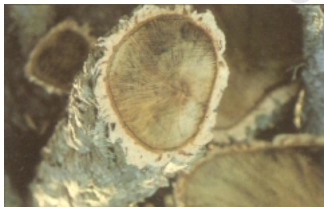
Artelatzaaren enborra, kortxoa ondo bereizten delarik