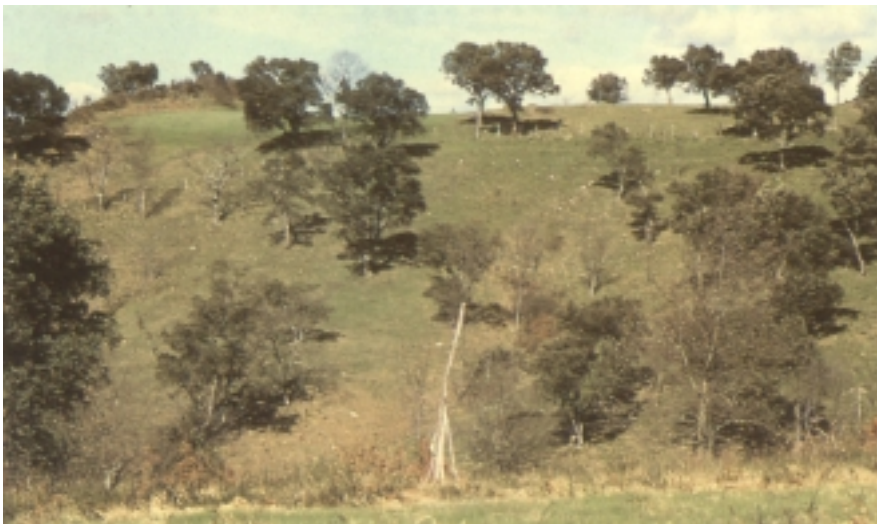
Artelatzez osaturiko zuhaitzi tipikoa, angio formako paisaia osatuz

erabiliko zen, baina otadi izan baino lehen alkornokal izango zen. Jakina denez, otea degradatutako basoetan sortzen da.