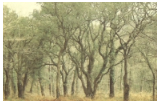
Zuhaitzirik onenak kontserbatu behar dira

Zuhaitz honen izenari buruz aipa- mentxo bat egitea ere oso interes- garria gerta daiteke. Zarautz eta Ge- tarian arkamurka edota arkamuka izenez ezagutzen da. Badirudi arka-