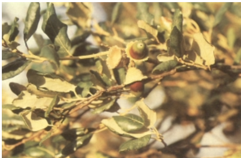
Adaska eta fruitua

murka hitza gaztelaniazko alcorno- que hitzetik etor daitekeela, “alcor- noque” hitza Zarautzen toponimian erabiltzen dela kontutan hartuz: