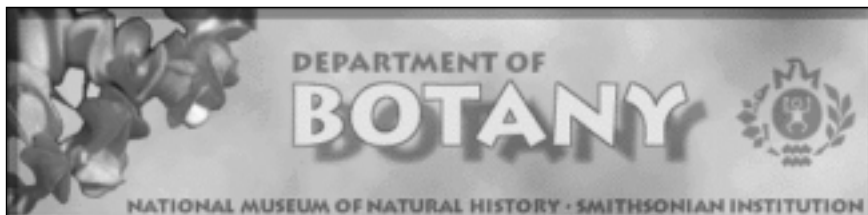
3. irudia Smithsonian Institution-eko Natur Zientzien Museoko Botanika Saileko web gunea