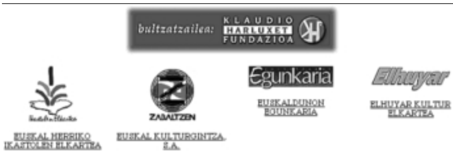
4. irudia. Jalgiren web gunearen orri nagusian sustatzaileen logotipoak ikus daitezke. Hauetako bakoitza mundu txikietan sartzeko atea da.

nahi du inoiz izan duzun posta-sistemarik merkeena duzula eskutan.