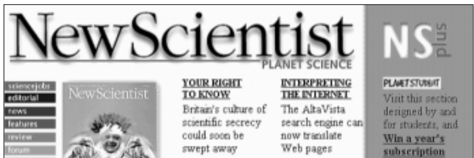
2.irudia. NewScientist zientzi aldizkariaren web gunea.