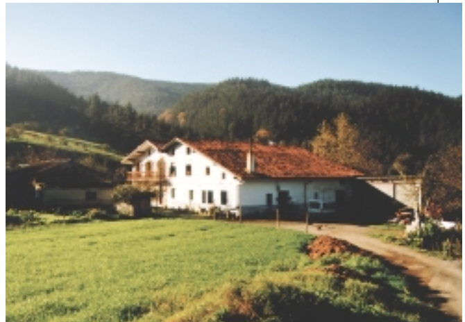
Garrantzi handiko elementua izan da baserria Euskal Herriko nekazaritzan.

XVIII. mendean, lurra karearekin ongarrizten hasi ziren eta kare gehiegi erabiltzeagatik lur asko erre egin zen bazterretan, laborantzarako lur onenak hondatu egin zirelarik.