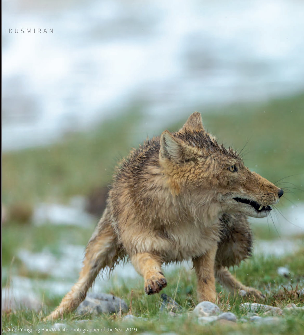
ARG.: Yongping Bao/Wildlife Photographer of the Year 2019.