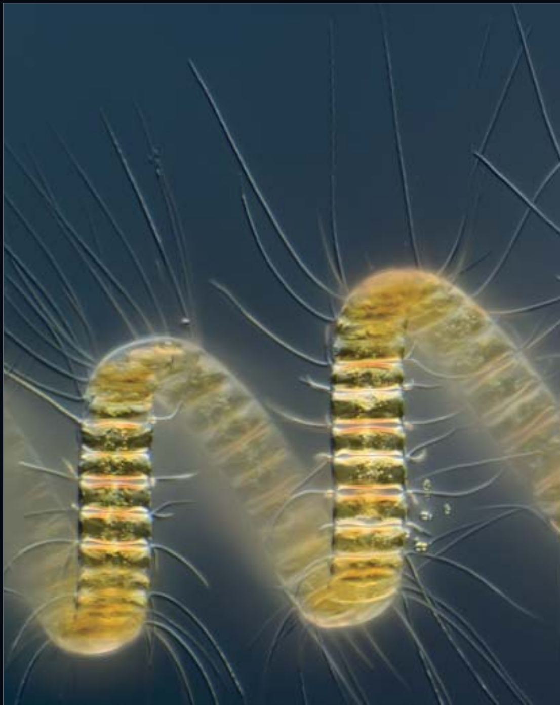
Chaetoceros debilis itsas diatomeoa (x250) Wim van Egmond (Herbehereak)