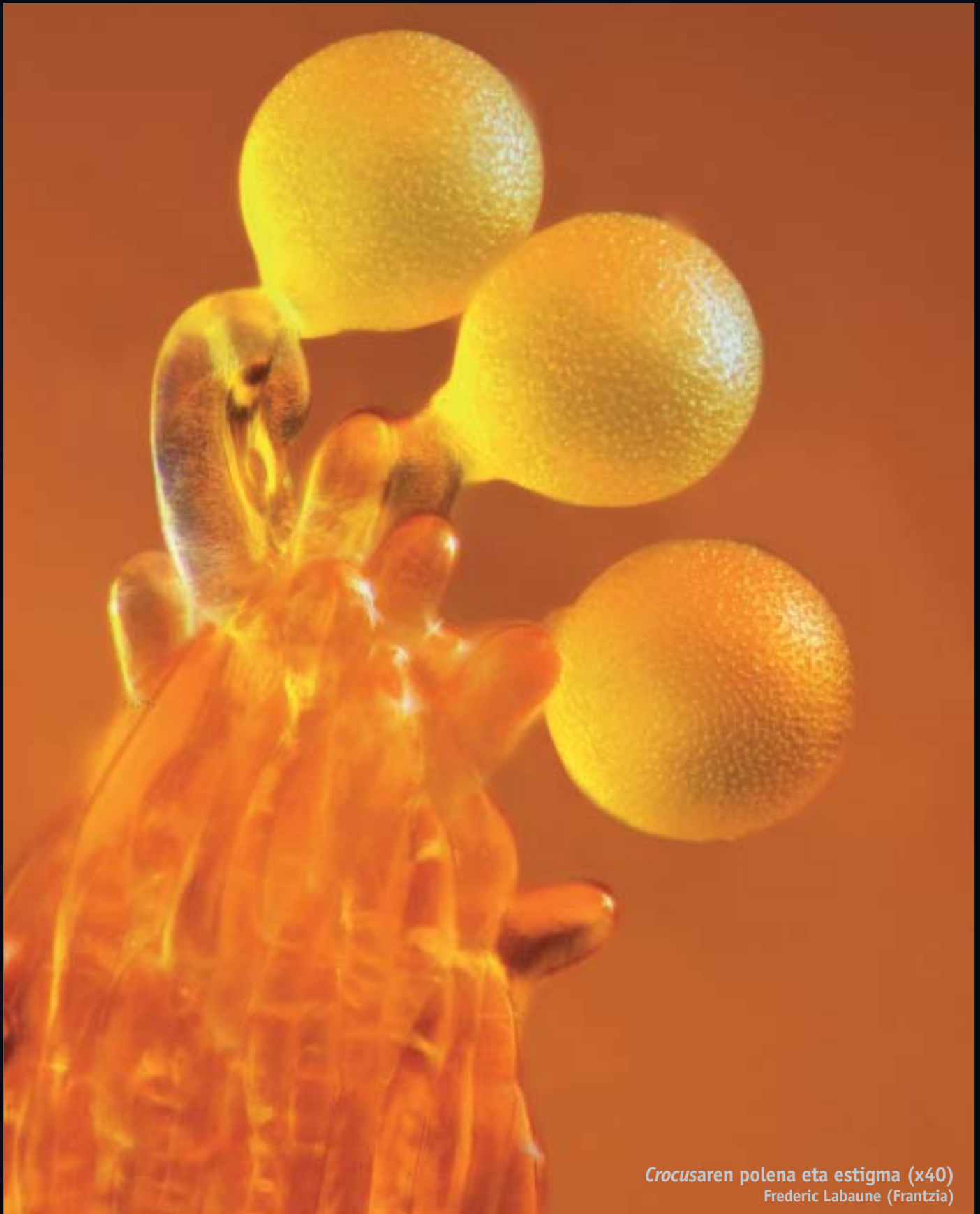
Crocusaren polena eta estigma (x40) Frederic Labaune (Frantzia)