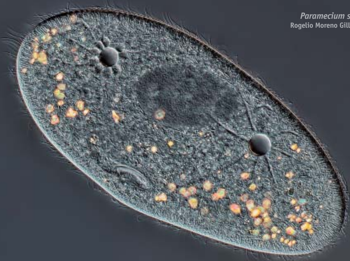
Paramecium sp. (x40) Rogelio Moreno Gill (Panama)