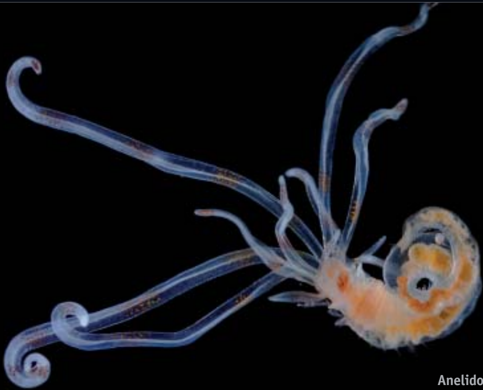
Anelido-larva (x100) Christian Sardet (Frantzia)