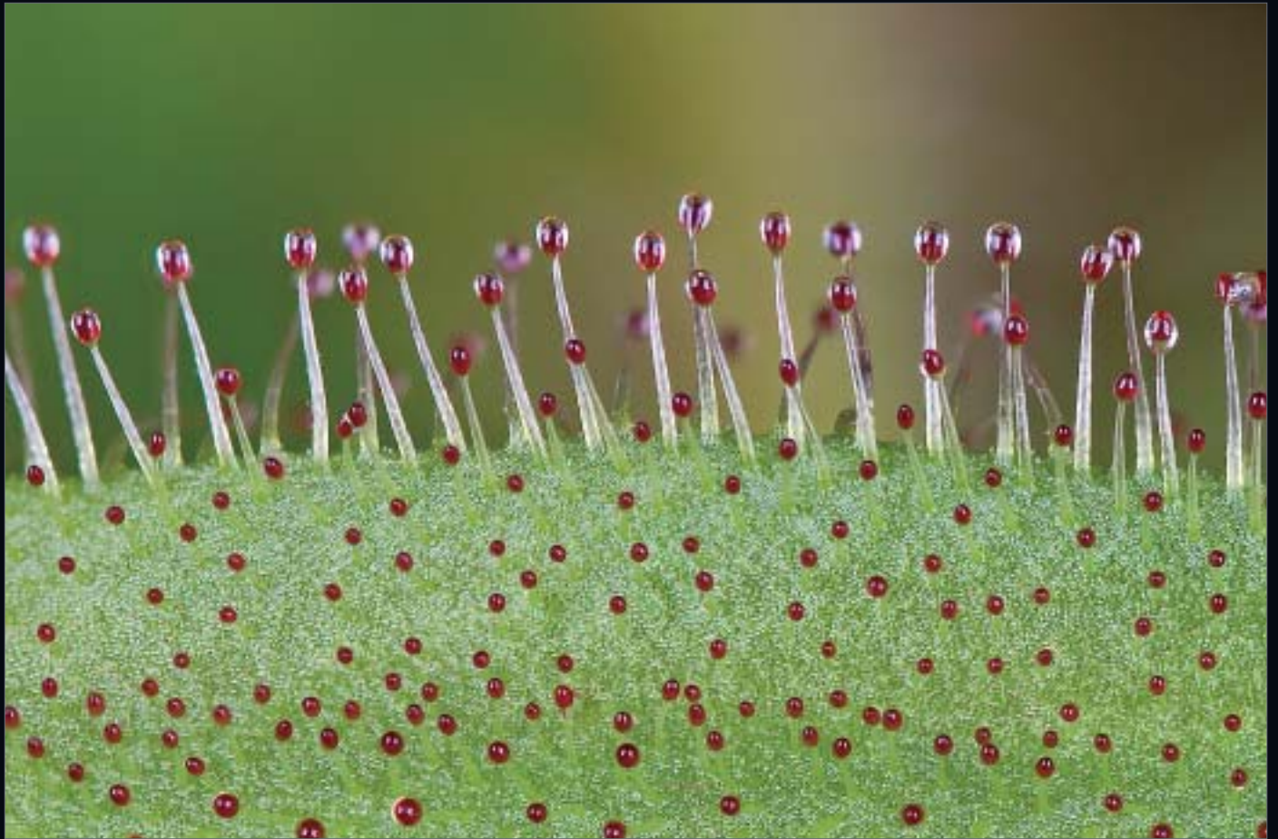
Drosera capensis landare haragijalearen hostoko guruinak (x10) Jose R. Almodóvar (Puerto Rico)