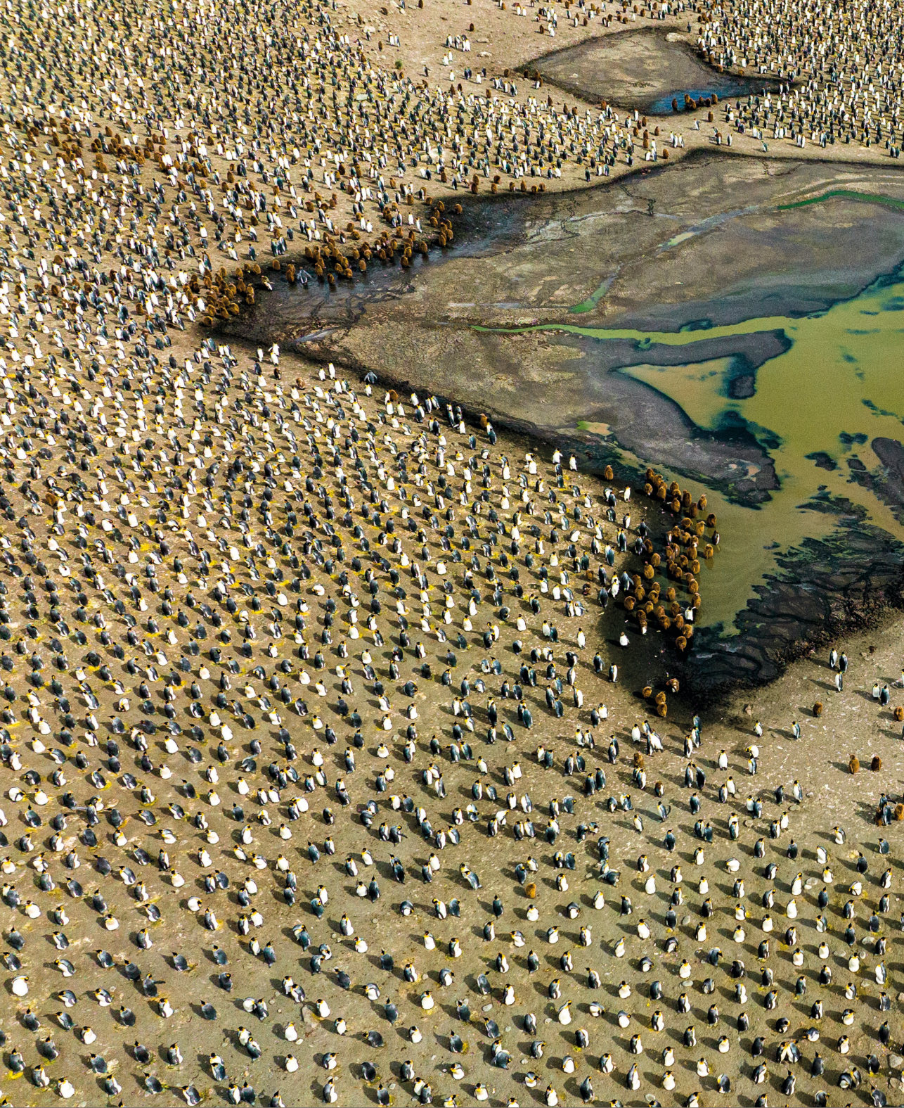
Gold Harburren elkartzea ( Gathering in Gold Harbour ) Renato Granieri