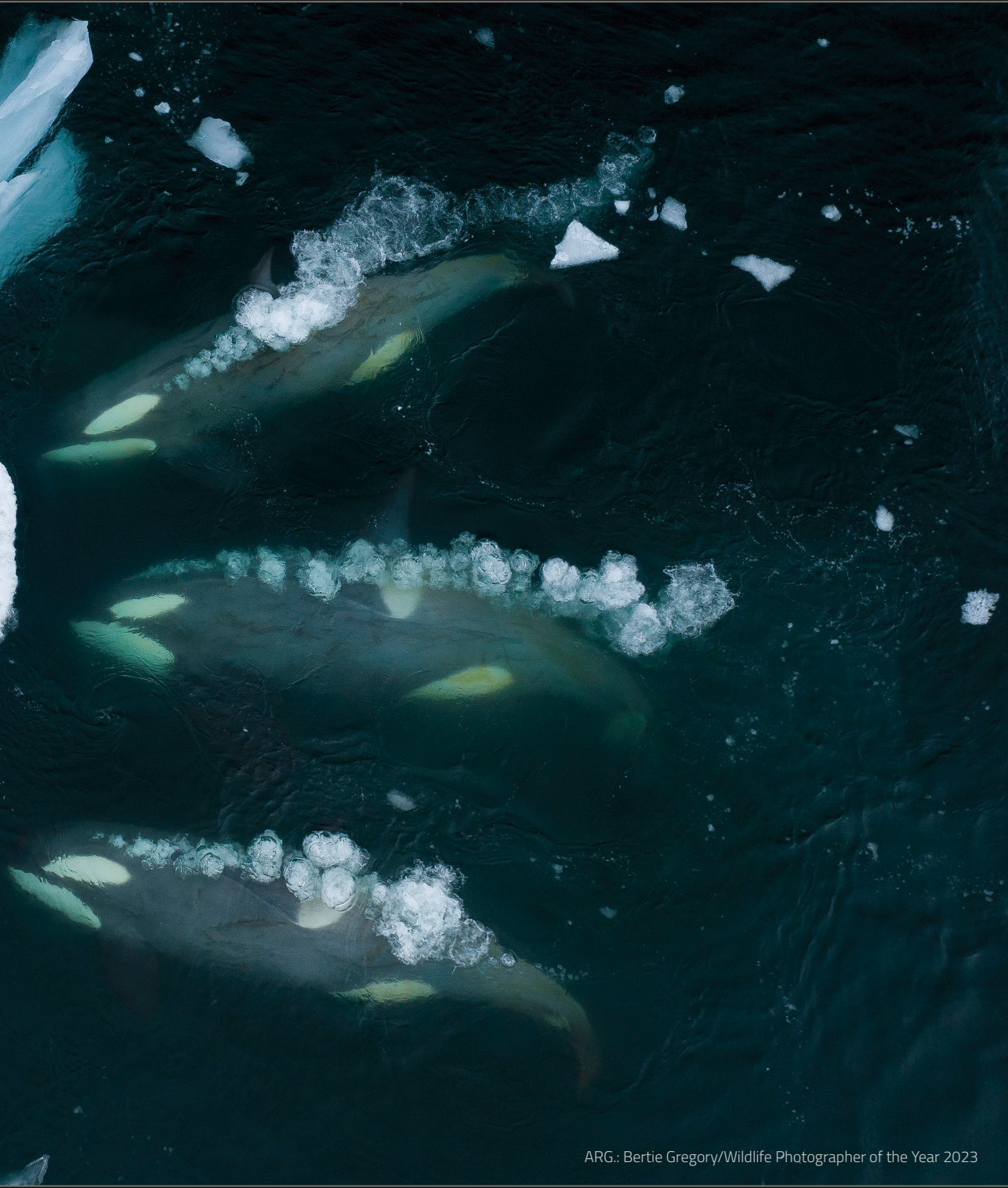
ARG.: Bertie Gregory/Wildlife Photographer of the Year 2023