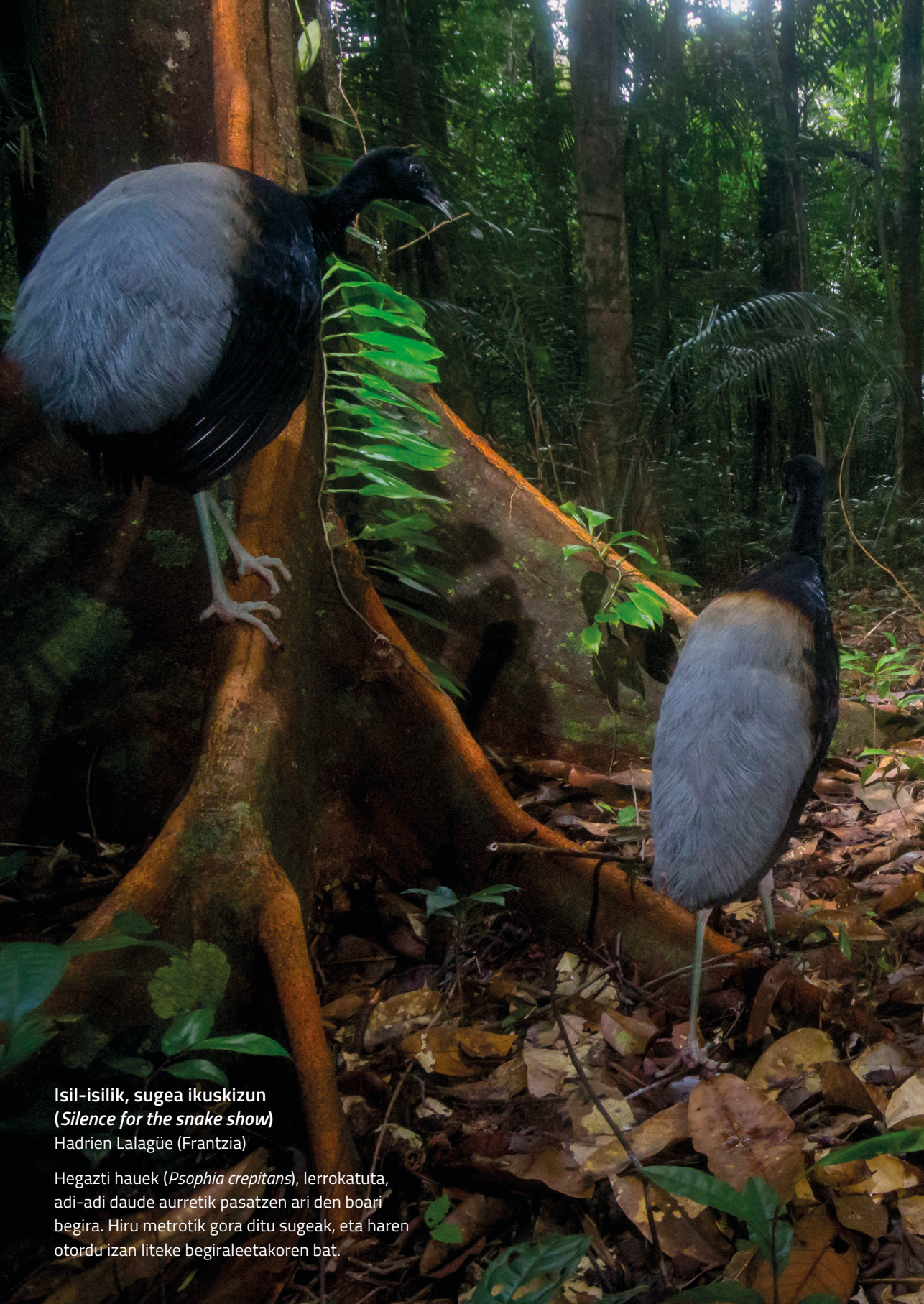
Isil-isilik, sugea ikuskizun ( Silence for the snake show ) Hadrien Lalagüe (Frantzia)

Hegazti hauek ( Psophia crepitans ), lerrokatuta, adi-adi daude aurretik pasatzen ari den boari begira. Hiru metrotik gora ditu sugeak, eta haren otordu izan liteke begiraleetakoren bat.