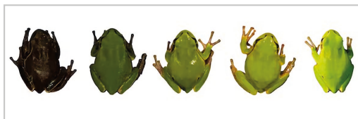
Txernobylen harrapatutako ekialdeko zuhaitz-igelak ( Hyla orientalis ).

2017tik 2019ra bitartean, 189 ekialdeko zuhaitz-igel ( Hyla orientalis ) aztertu zituzten, erradiazio-maila desberdineko 12 puntutan (batzuk eremu babestuaren barruan, eta beste batzuk kanpoan). Eta azalaren koloreaz gain, igel bakoitzak jasotako erradiazio-dosia eta oxidazio-estresa ere neurtu zituzten.