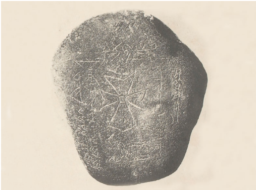
Sanmaq-en hilobiaren inskripzioa. Dioenez, 1338an hil zen, izurriak jota.

Jakina zen 1347an sartu zela izurri beltza Mediterraneora, Urrezko Hordatik zihoazen merkataritza-ontzien bidez. Europan, Ekialde Hurbilean eta Afrikaren iparraldean hedatu zen, eta, leku batzuetan, populazioaren % 60 hil zela kalkulatu da. Haren ondotik etorri zen bigarren olatuak XIX. mendera arte iraun zuen.