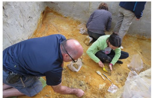
Arkeologoak, Aranbaltza II aztarnategian lanean.

Aranbaltza II berezia da, Paleolitoko Kantauriko aztarnategi gehienak kobazuloetan baitaude, eta Aranbaltza, berriz, aire librean. Beraz, aparteko interesa du, neandertalen bizimoduari buruzko bestelako informazioa ematen baitu. Aranbaltza II-k, gainera, inguruan ohikoa den Erdi Paleolitoko harrizko tresneriarekin (Musteriarra) zerikusirik ez duen beste kultura bateko tresnak ditu, Chatelperroniar kulturakoak, hain zuzen. Azterketa kronologikoak erakutsi duenez, gutxienez mila urteko eten bat dago bi kulturen artean.