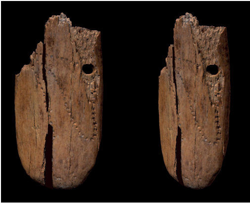
Stajnia kobazuloan (Polonia) aurkitutako zintzilikari apaindua.

Mamut-letaginez egindako zintzilikari apaindu bat da orain arte aurkitu den Eurasiako bitxirik zaharrena. Stajnia kobazuloan aurkitu zuten (Polonia), 2010ean, zaldi-hezurrez egindako tresna batekin batera, eta, erradiokarbonoaren datazio zuzenaren bidez, 42.000-37.000 urte dituela kalkulatu dute. Egileen arabera, ezagutzen den bitxi apaindu zaharrena da, eta pentsamendu sinbolikoaren sorrerarekin eta Homo sapiens espeziearen hedapenarekin erlazionatuta dago. Scientific Reports aldizkarian eman dute ikerketaren berri.