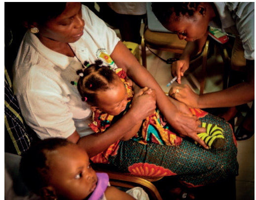
Malariaren aurkako haurren txertaketa pilotuaren une bat, Ghanan.

Urtean, 5 urtetik beherako 260.000 haur hiltzen dira malariak jota Saharaz hegoaldeko Afrikan. Heriotza horiek eragotz ditzakeen txerto bat baimendu berri du Osasunaren Mundu Erakundeak. "Une historikotzat" jo du Tedros Adhanom Ghebreyesus OMEren zuzendari nagusiak.