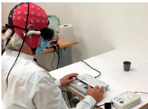
ARG.: Nature Medicine .

Erretinosi pigmentarioa du pazienteak. Gaixotasun horrekin, erretinan argiarekiko sentikorrak diren zelulak degradatzen dira, eta ikuseremua murriztuz joaten da, guztiz galdu arte. Orain arte ez da lortu tratamendu eraginkorrik, baina optogenetikak frogatu du gaixotasun neurologikoetan aukera ematen duela neuronon funtzioa berreskuratzeko.