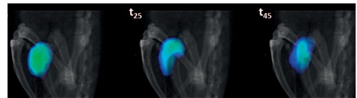
Nanorrobotak uretan sartu eta 0, 25 eta 45 minuturen buruan hartutako PET-CT irudiak.

Nanorrobotak medikuntzan oso erabilgarriak izango direla aurreikusten da. Izan ere, nanometro bateko tamainako osagaiak dituzten makinak dira, organismo baten barruan era autonomoan mugitzeko gaitasuna dutenak. Edozein aplikazio mediko izan dezaten, ordea, funtsezkoa da nanorrobotek mugimendu koordinatuak egitea, medikuek kontrola dezaten nola mugitzen diren organismoaren barruan. CIC biomaGUNEko ikertzaileek, lehen aldiz, nanorrobot-multzo bateko sagu bizien barruan duen portaera monitorizatu dute, eta ikusi dute arrain-sarden moduan mugitzen direla. Alegia, modu koordinatuan mugitzen dira.