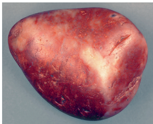
Wyomingen, Morrison aztarnategi jurasikoan aurkitutako ustezko gastrolito bat, 6 cm-koa.

Dinosauroen gaur egungo ondorengoetan, hegaztietan, ohikoa da harriak horrela erabiltzea. Eta dinosauroen fosil batzuen artean aurkitu izan dituzte antzekoak. Kasu honetan, ordea, ustezko gastrolitoen inguruan ez dute dinosauroen arrastorik topatu, eta, beraz, ez dute horren aldeko frogarik. Hala, hipotesi-mailan geldituko da kontua, oraingoz. Terra Nova aldizkarian argitaratu dute lana. ●