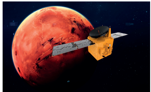
ARG.: UAE Espazio Agentzia.

Arabiar Emirerri Batuek bidaltzen duten lehen zunda da Al Amal (itxaropena, arabieraz), eta Marteren orbitan da jada. Uztailean jaurti zuten, eta otsailean sartu zen, arrakastaz, Marteren orbitan. Planeta gorriaren bueltan ibiliko den seigarren zunda da, lehendik han baitabilta hiru zunda estatubatuar, bi europar eta indiar bat.