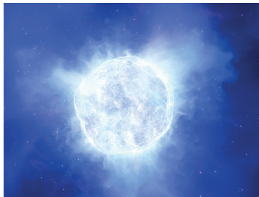
Lehertu aurretik Kinman galaxian kokatutako izarrak izan zezakeen itxura, irudikapen baten arabera.

75 milioi argi-urtera dagoen Kinman galaxian zegoen izarra, eta, haren bizitzaren azken uneetan egonik, duela hogeita urtetik zientzialariek jarraipena egin diote. Alabaina, iaz Txileko VLT teleskopioa galaxia horri begira jarri zutenean konturatu ziren izarra desagertuta zegoela. Supernobarik egon ez bada ere, aurreko urteetan hainbat leherketa atzeman dira galaxia horretan, eta horiek ere izarraren amaierarekin lotuta egon daitezkeela uste dute. ●