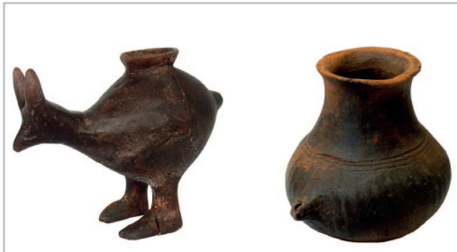
Brontze Aroko ontziak (K.a. 1200-800 urte).

Inoiz, Neolito garaiko zeramikazko ontzi txikiak aurkitu izan dira, likidoak isurtzeko balio zezakeen tutu edo mutur bat dutenak. Zaharrenak duela 5.000 urte ingurukoak dira, eta pentsatzen da biberriak izan zitezkeela. Orain, ikerketa batek hipotesi horren aldeko zantzu berriak aurkitu ditu, esne-hondarrak identifikatu baititu halako hiru ontzitan.