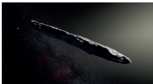
Oumuamua asteroidearen irudikapena.

Astronomiaren historian lehenengo aldiz, eguzki-sisteman sartu den asteroide bat aurkitu dute. Orain arte gurean aurkitu izan diren beste kometa eta asteroideak eguzki-sisteman bertan sortutakoak ziren, baina Oumuamua asteroide berria kanpoan sortutakoa da; milioika urte eman omen ditu espazioan bidaiatzen eguzki-sisteman ezustean sartu aurretik.