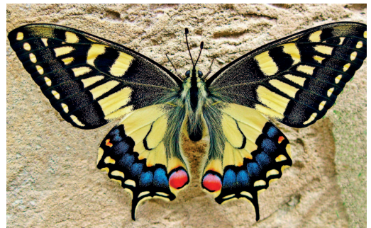
WntA geneak hegoetako lerroak marrazten ditu, eta optix geneak, kolorea.

Jakina da hegoen ereduak tximeleten erakargarritasun sexualaren oinarrian daudela, eta harrapakarietatik babesteko ere erabiltzen dituztela. Baina artean ezezaguna zen nola sortzen diren marrazkiok, nola sortzen diren marrazkiak eta puntuak, eta haien konplexutasuna. Geneon aktibitate CRISPR teknika ren bidez argitu dute New Yorkeko Cornelleko Unibertsitateko biologoek. Adierazi dutenez, intsektuen hegoetako ereduaren garapenaren paradigmatari desafio egiten dio aurkikuntzak. ●