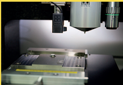
Cu-Al-Ni aleazioarekin eraikitako zutabeak. Bakoitzak 500 nm inguruko diametroa du.

Ikertzaileen arabera, eskala horretan materialaren portaera aldatu egiten da, eta gero eta tentsio handiagoa behar du superelastikotasuna azal dadin. Portaera hori azaltzen duen eredu atomikoa ere proposatu dute. Nature Nanotechnology aldizkarian eman dute ikerketaren berri.