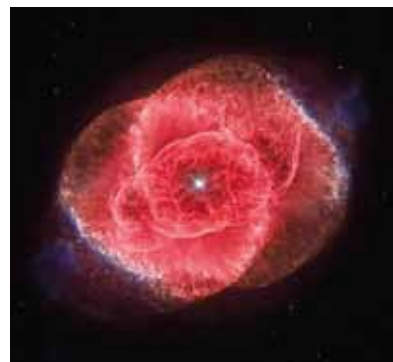
Katu-begia nebulosa Hubbletik.

Katu-begia ageri da argazkian —NGC 6543 deritzon planeta-nebulosa—, Lurretik hiru mila argi-urtera. Eguzkiaren antzeko izarren bizitzaren azken faseak dira planeta-nebulosak; hortaz, izar horren heriotzaren fasea irudikatzen du Hubble teleskopioak hartutako argazkiak. Hubblek ematen duen informazioa baliagarria da Katu-begiaren nebulosaren eboluzioa ezagutzeko, eta, ondorioz, lagungarria izan daiteke gure Eguzkiaren etorkizuna aurreikusteko. Izan ere, Eguzkiak ere eboluzio lainotsua izango du, bost mila milioi urte barru edo. ●