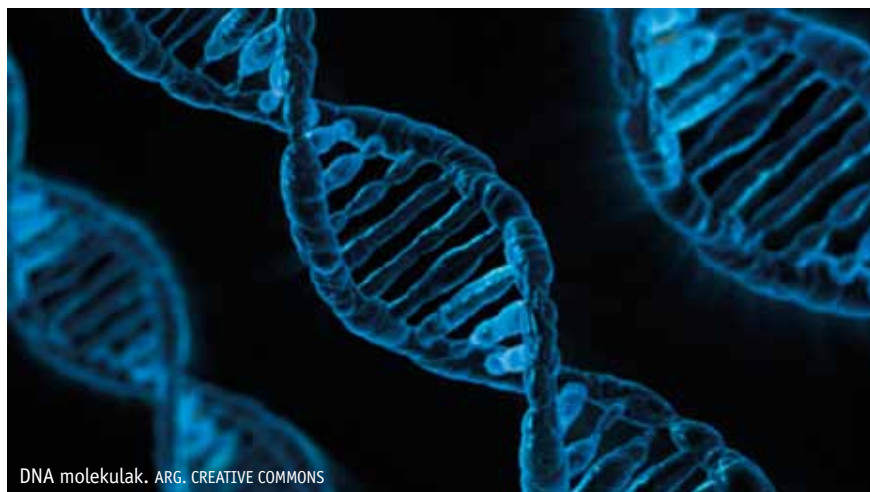
DNA molekulak.

Aurkikuntza garrantzitsua da, batetik, antibiotikoekiko erresistentziari aurre egiteko estrategiak garatzeko balio dezakeelako, eta, bestetik, prozesu bioteknologikoen emaitzak hobetu ditzakeelako. Nature Communications aldizkarian argitaratu da ikerketa. ●