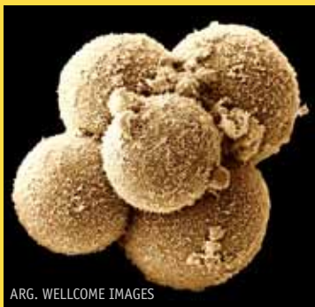
ARG. WELLCOME IMAGES

Guangzhou Unibertsitateko Medikuntza Institutuko ikertzaileek ondorioztatu dute egin duten lana baliagarria dela eraldaketa genetikoa aurreratzen joateko, baina oraindik badirela gaitortu beharreko arazo teknikoak. Arazo horiek konpondu arte eta teknika eragin-korra eta segurua dela frogatu arte, giza enbrioiaren ez aplikatzeko ere gomendatu dute. ●