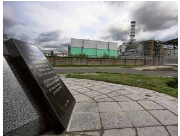
Txernobyngo zentralaren 4. erreaktorea eta oroimenezko plaka.

duen ebidentzia nabarmenena. Eta ez segurtasun-akatsak egon zirelako bakarrik —lurrikarak ohikoak diren leku batean egotea, adibidez—, baizik eta jendea ez zutelako behar bezainbeste informatu gertatutakoaren eta arriskuen gainean. ●