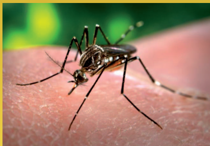
Aedes aegypti eltxoa, pertsona bati heltzen.

Munduko Osasun Erakundeak Zika birusarengatik mundu-mailako larrialdi egoera ezarri du. Izan ere, infekzioak izugarri ari dira hedatzen, bereziki Amerikako eremu tropikaletan, eta, horrekin batera, asko areagotu dira mikrozeftalia-kasuak jaioberrian, eta Guillain-Barré sindrome-kasuak.