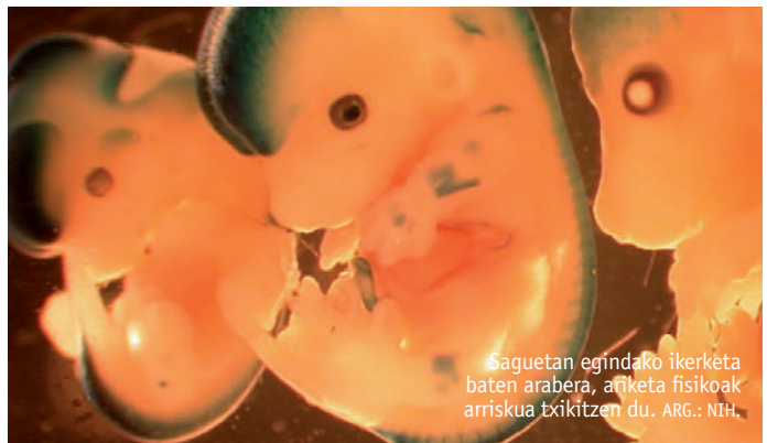
Saguetan egindako ikerketa baten arabera, ariketa fisikoa arriskua txikitzen du. ARG.: NIH.

tsitateko ikertzaile batzuek egin duten ikerketa honek. Izan ere, ez zen ezagutzen gaixotasun hori izateko arriskua amaren adinari lotuta egotearen arrazoia obuluan zegoen edo amarengan. Hori ikertzeko, sagu gazteei sagu zaharren obarioak eta, alderantziz, zaharrei gazteen obarioak, transplantatu zizkieten. Eta ikusi dute lehenengo kasuan (sagu gaztea + obario zaharra) ez dela ondorengo gaixotasuna izateko arriskua handitzen, eta bai bigarrenean (sagu zaharra + obario gaztea). Alegia, amaren berraren adina dela umeei gaixo-