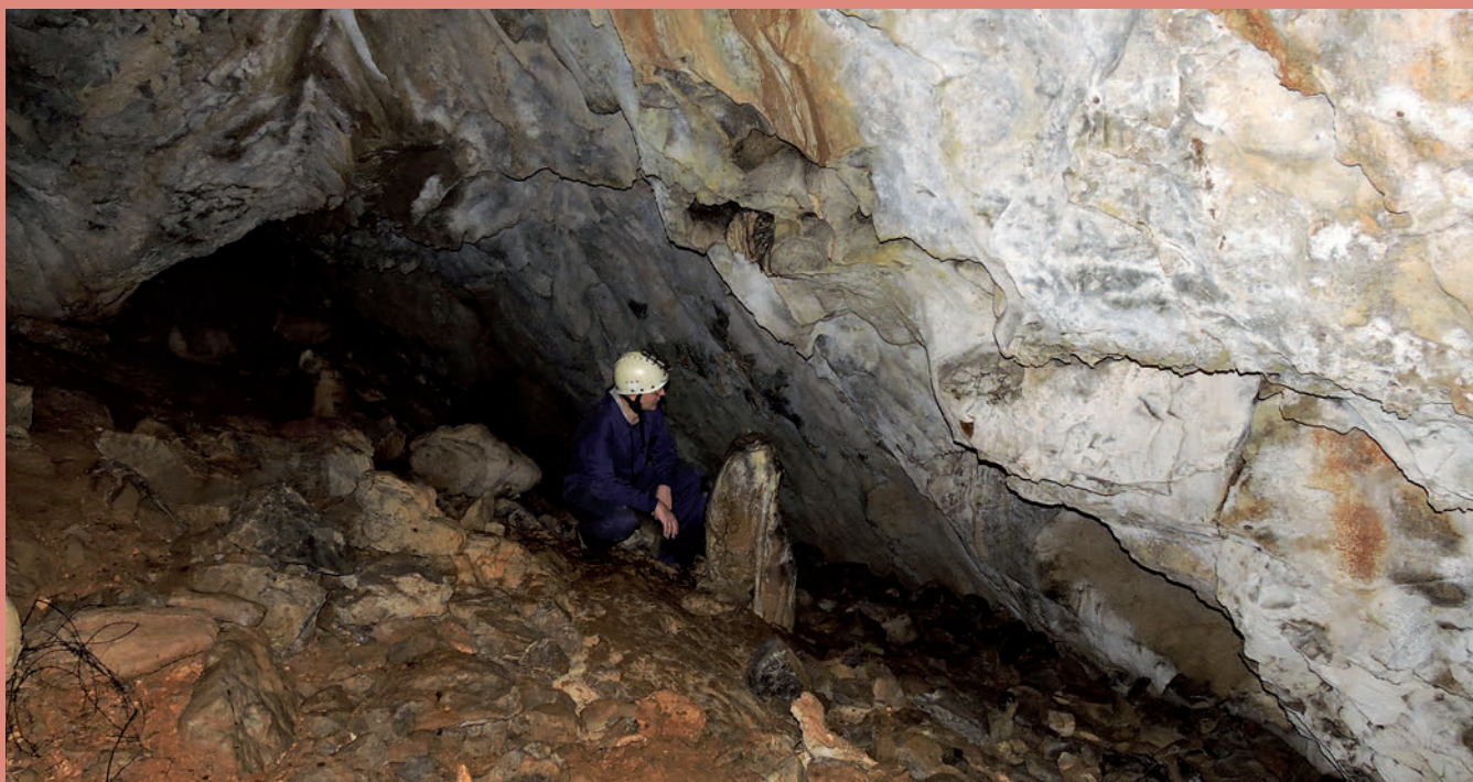
Kalkulatu dute margoek gutxienez 18.000 urte dituztela.