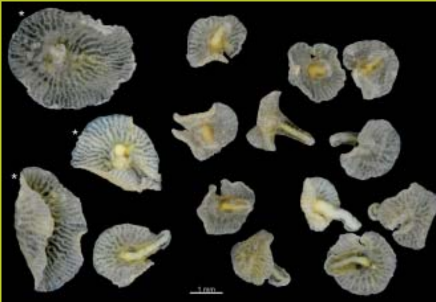
Espezieen sailkapenean lekurik ez zuten itsas izakiak.

Artikuluari, bi espezieak deskribatzeaz gain, Ediacara periodoan bizi ziren medusoide batzuekin erlazioan egon daitezkeela jakinarazi dute —aipatzekoa da garai hartako fauna duela 500 milioi urte galdu zela—. Haien ustez, eboluzioan, Bilateria taldea baino lehenagokoak direla esan dute, baina historia ebolutiboan ulertzeko, zuhaitz filogenetikoan dagoeneko finkatuta dauden adar batzuk hobeto ezagutu beharko liritekeela ere adierazi dute. ●