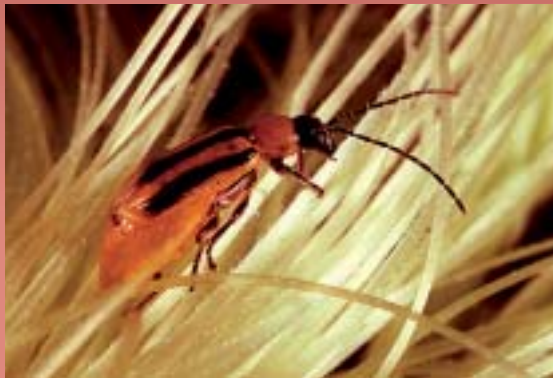
Diabrotica virgifera virgifera harrari aurre egiteko modua itzuli nahi diote artoari.

Arto-barietate berriak antzinakoak baino emankorragoak badira ere, intsektuekiko eta beste patogeno batzuekiko zaurgarrikerikoa dira, haiei aurre egiteko gaitasuna