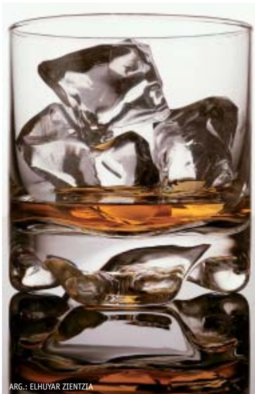
ARG.: ELHUYAR ZIENTZIA

Alkoholak neuronei eragindako kalteak maila molekularrean zehaztu dituzte EHUko Neuropsikofarmakologia taldeko ikertzaileek, Nottighamko Unibertsitatearekin elkarlanean. 20 pertsona alkoholikoren garunen analisia egin dute, zehazki, garun-azal prefrontalarena. Uste da eremu horrek funtzio exekutiboak kontrolatzen dituela —esaterako, estrategien plangintza eta diseinua, lanerako memoria, arreta selektiboa edo portaeraren kontrola—, eta, ondorioz, eremu horretako neuronak ikertzeak alkoholaren mende bizi diren pertsonen izaten dituzten portaera-asadurak hobeto ulertzen lagun dezake.