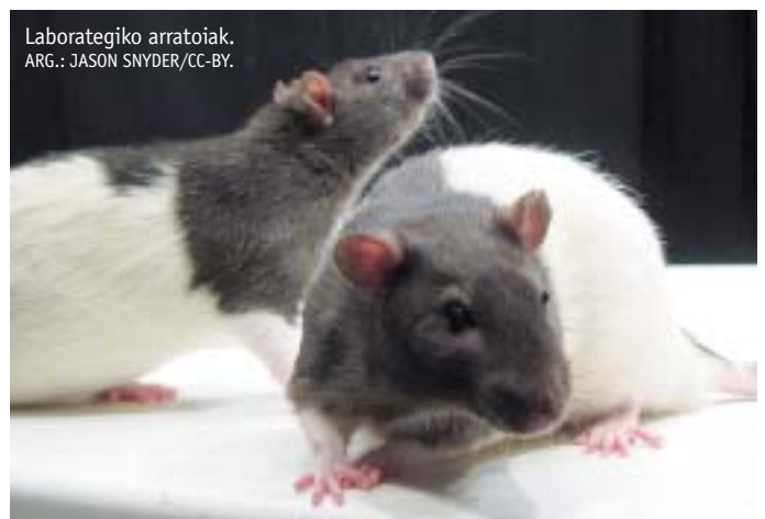
Laborategiko arratoiak.

Animaliekin egindako ikerketek ez ezik, zelulekin egindakoei ere eragingo die neurriak. Hain zuzen, Nature n bertan aipatzen dutenez, “gehiagitan” ez da aintzat hartzen zelula-lerroen sexua, in vitro egindako ikerketetan. Alabaina, arrak eta emeen