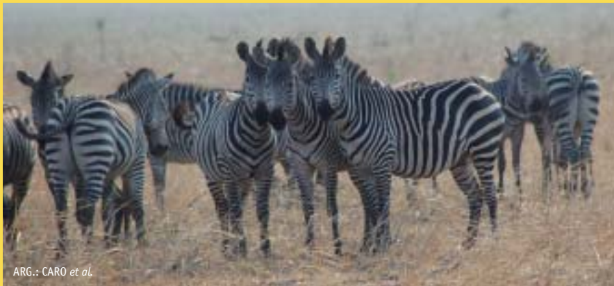
ARG.: CARO et al.

Lana Nature Communications aldizkarian argitaratu da, online. ●