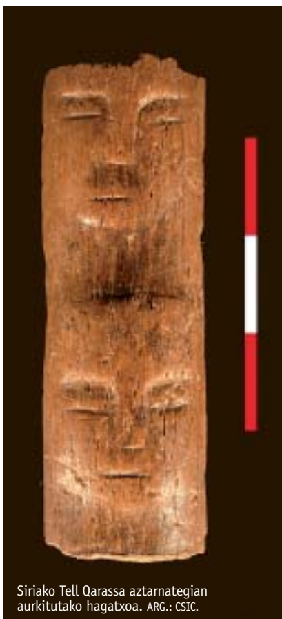
Siriako Tell Qarassa aztarnategian aurkitutako hagatxoak.