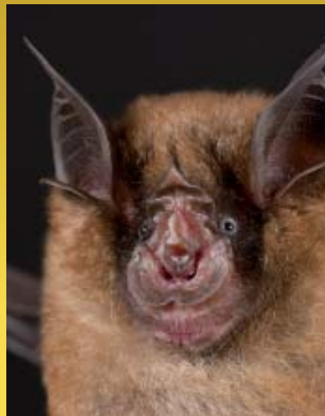
Txinako ferra-saguzarra, Rhinolophus sinicus , gizakia ere infektatzen duen SARSaren birusaren gordailu naturala izan daitekeela uste dute ikertzaileek.

SARS birusak eragindako ez-ohiko pneumonia gaitz larria da, eta, pandemia eragiteko gaitasuna du. Horregatik, arreta handiz jarraitzen diote birusaren aldaerei osasun-arduradunek. ●