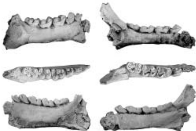
Zanbranan topatutako Microchoerus primaterearen fosilak.

Microchoerus primatea desagertuta dago gaur egun, baina Afrikan