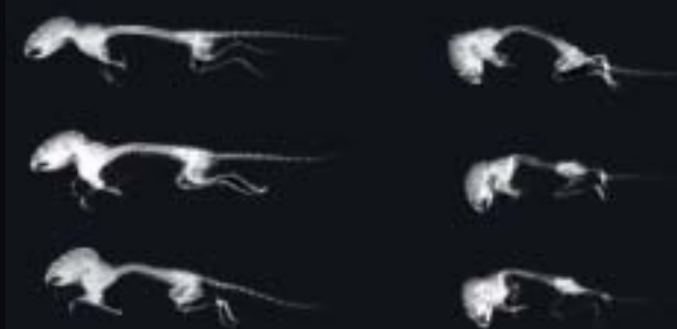
Esperimentuan erabilitako saguen erradiografiak. Ezkerrean, tratatutako saguak, eta, eskuinean, tratatu gabek.

Hori horrela izanda, INSERM institutuko taldekoei hazkuntza-faktoreak murriztea bururatu zitzaion. FGFR3 hartzailearen kopia askeak saguei emanda, hazkuntza-faktoreak errezeptore guztien artean banatzen dira, eta zelulen paretan daudenetara ez dira gehiegi iristen. Hala, tratatutako saguek ez zituzten akondroplasiaren sintomak garatu, eta normaltasunez hazi ziren. ●