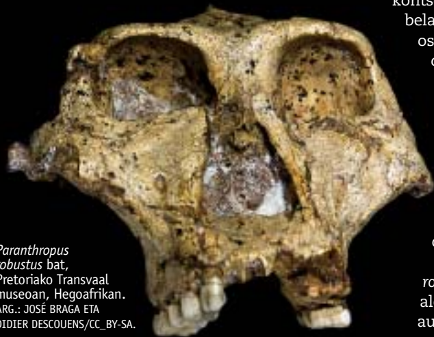
Paranthropus robustus bat, Pretoriako Transvaal museoan, Hegoafrikan.