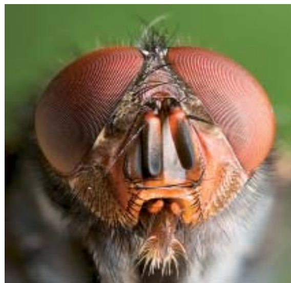
Calliphora vomitoria euli sarraskijalea.

Eulietatik gorpuen DNA berreskura zitekeela frogatu zuten lehenik ikertzaileek. Eta gero 115 euli harrapatu zituzten, ausaz, Cote d'Ivoireko eta Madagaskarko baso banatan. Eulien % 40an atzeman zuten DNA identifikagarria. Cote d'Ivoiren 16 ugaztun identifikatu zituzten —ezagutzen diren 9 primateetatik 6, eta desagertzeko arriskuan dagoen antilope arraro bat barne—,