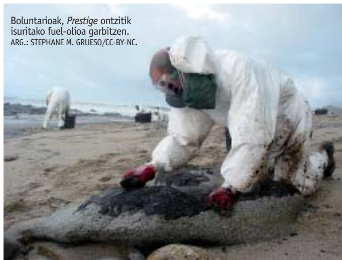
Boluntarioak, Prestige ontzitik isuritako fuel-olioa garbitzen.

Journal of Toxicology and Environmental Health aldizkarian argitaratu dute ikerketa, eta, ikertzaileen ustez, ondorioak baliagarriak dira fuel-olioaren eraginpean dauden pertsonentzat, ez bakarrik isuriak garbitzen aritzen direnentzat, baita petrolio-hobietan, birfindegietan gasolindegietan eta halakoetan lan egiten dutenentzat ere. ●