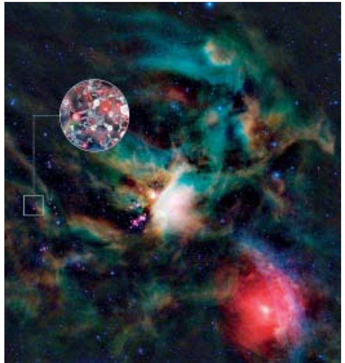
Glikoaldehido-molekula, IRAS 16293-2422 izar bitar gaztearen inguruan.

Ikerketa oso baliagarria da ulertzeko nola erazten diren azukre-molekulak espazioan. Hala ere, ikertzaileek aitortu dute ikerketa gehiago egin beharko direla mekanismo horiek ondo ezagutzeko. ●