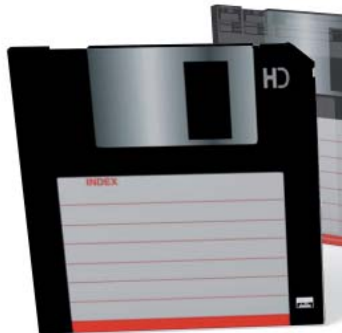
IRUDIA: GUILLERMO ROA/ELHUYAR FUNDAZIOA

bizi da, eta Macintosh ordenagailu zahar-rak biltzen ditu. Disketeak haien adinarekin bat datorren ordenagailu batean sartzea proposatu du. Apal batetik kutxa bat hartu du, eta, kontu handiz erabili du, eskuartean Ming ontzi bat balu bezala. Nork dio ez dela hura bezain baliotsua?