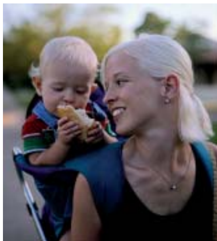
ARG.: ELHUYAR FUNDAZIOA

Zehazki, hautespen naturalaren eta sexualaren galbahe nagusiak gurutzatu dituzte erregistroetan bildutako datuekin: adin ugalkorrera arte bizirautea, ugalkidea lortzea, ugaltze-arrakasta eta ugalkortasuna (ugalkideko ondorengo-kopurua). Zerga-kontuak zirela eta, Finlandiako orduko elizak zehatz-mehatz jasotzen zituen jaiotza, heriotza eta ezkontza denak, eta ikertzaileek genealogiaren jarraipen osoa egin ahal izan dute. Populazio monogamoak izaki —hala ez jokatzea